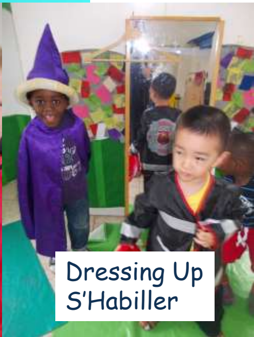
Dressing Up S'Habiller