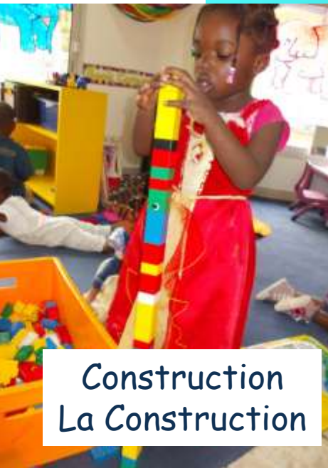
Construction La Construction