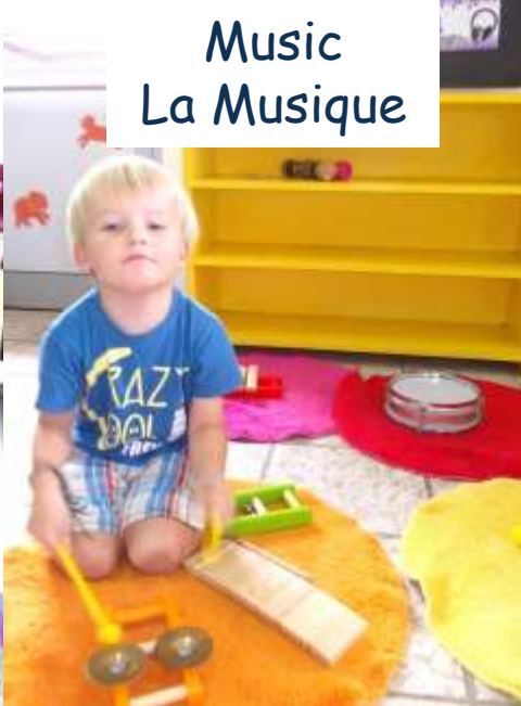
Music La Musique