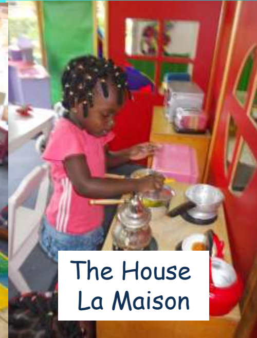
The House La Maison