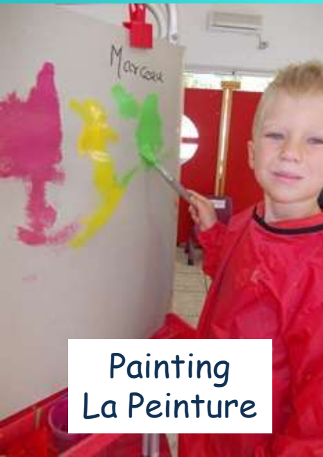
Painting La Peinture