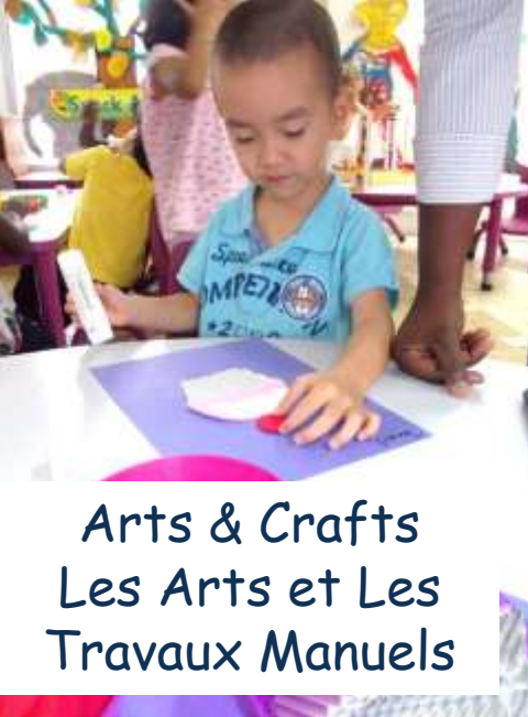
Arts & Crafts Les Arts et Les Travaux Manuels