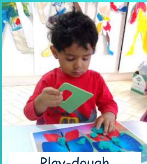
Play-dough La pâte à modeler

L' école commence à 7h45 et finit à 10h15. Assurez-vous s'il vous plaît que vous, ou la personne qui vient chercher votre enfant, soit à l'heure. On commence le jour avec les puzzles, la pâte à modeler, les formes et L'Heure du Cercle.