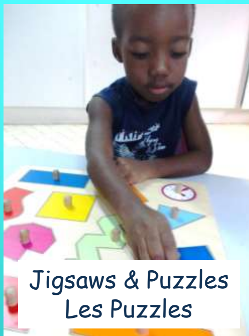
Jigsaws & Puzzles Les Puzzles