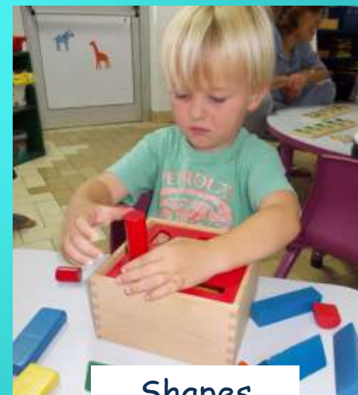
Shapes Les Formes