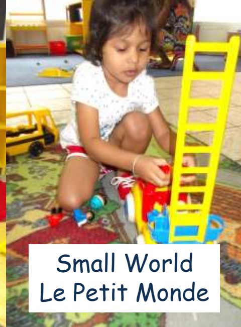
Small World Le Petit Monde