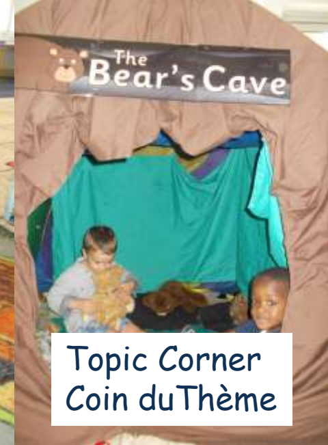
Topic Corner Coin du Thème